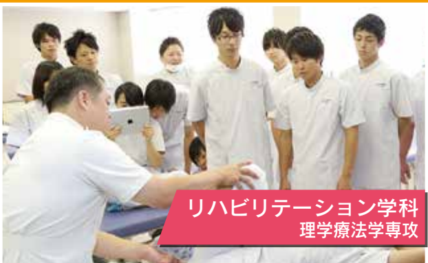
リハビリテーション学科 理学療法学専攻