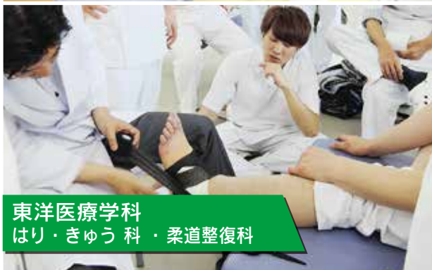
東洋医療学科 はり・きゅう科・柔道整復科