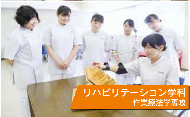
リハビリテーション学科 作業療法学専攻